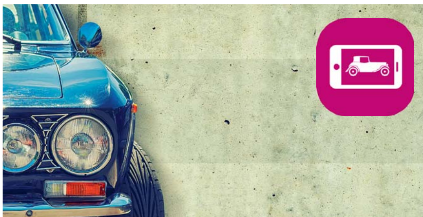
BlueNOW! Classic: Das ist der digitale Fahrzeugcheck per Smartphone durch TÜV SÜD Experten.

TÜV SÜD Classic | Der digitale Fahrzeugcheck BlueNOW! Classic erweist sich als wertvolles Tool zur Begutachtung historischer Fahrzeuge aus der Ferne. TÜV SÜD Oldtimer-Experte Norbert Schroeder sieht großes Potenzial für die Technik.