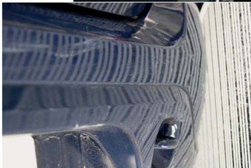
Der Lackschaden ist erst auf den zweiten Blick sichtbar.

cherer bei Haftpflichtschäden mittlerweile sehr kostenbewusst agieren und die Rechnungen genauestens prüfen. Die fundierten Schadengutachten, der Kontakt zu spezialisierten Rechtsanwältinnen und der enge Kontakt zum Sachverständigen bei Rückfragen spart hier manchen Euro für das Autohaus. Das spricht sich rum.