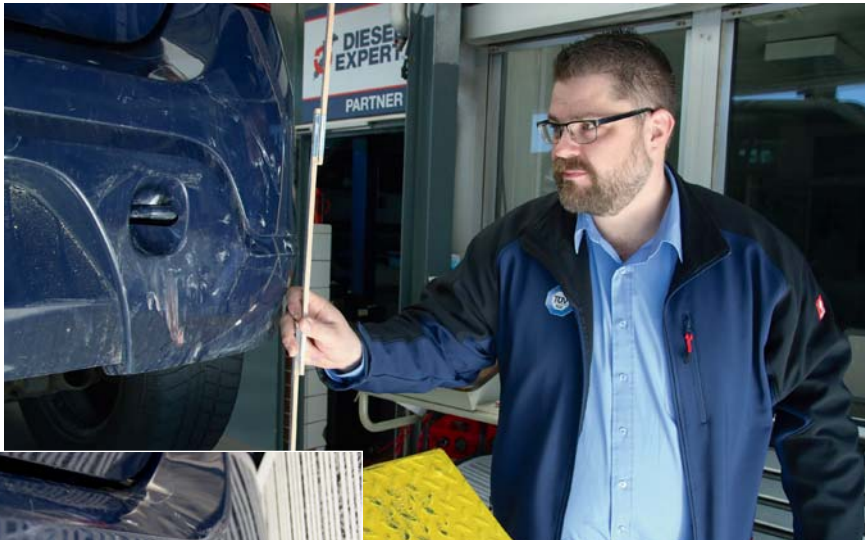
Ein gutes Maß an Akribie gehört zum Geschäft.

Weitere Informationen erhalten Sie unter WWW.CTEK.COM